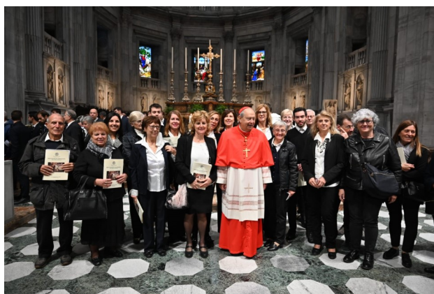
Foto al centro: si lascia ai lettori riconoscere le due coppie festeggiate con alcuni familiari e l'occasione del festeggiamento!!! Foto in basso: la Corale Parrocchiale di Lipomo con il cardinale Oscar Cantoni al termine della celebrazione che ha visto molti cori della Diocesi riunite per il loro Convegno domenica 23 ottobre. Si anticipa che gli animatori liturgici del canto e i ministri della Santa Comunione si troveranno presso la Pro Loco che qui si ringrazia, per il pranzo conviviale domenica 4 dicembre alle ore 12.00.

Foto a sinistra: alcuni bambini di quarta elementare e ragazzi di prima media al termine della Santa Messa di domenica 23 ottobre. Cresimati e comunicati con le loro famiglie si sono poi ritrovati in oratorio per una allegra cena comunitaria. Si ricorda alle famiglie che la migliore catechesi è la partecipazione alle celebrazioni.